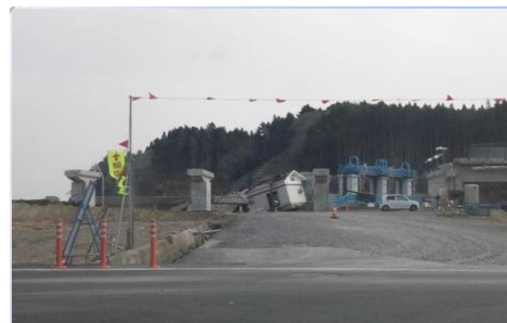
小学校正面の様子