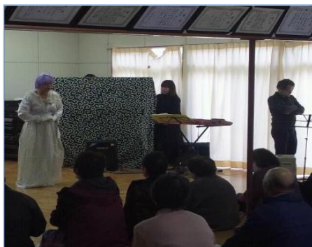
南三陸町を名古屋の小劇団が訪問