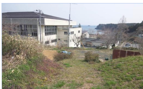
歌津児童館建設予定地

現在Solaでは、津波でほとんどの建物が流されてしまった南三陸町の歌津という地域に、子どもたちが自由に安心して遊ぶことのできる児童館を建てて、活動を広げようとしています。地元の方が、小・中学校の上にある高台の土地を無償で貸して下さることになり、建設会社の協力も得て、計画が進行しています。他の地域と同様、ここが子どもたちの安らぎの場所となり、一人ひとりが健やかに成長していけるよう準備を進めています。（歌津には、近く第二クリスチャンセンターも建てられる予定です。）