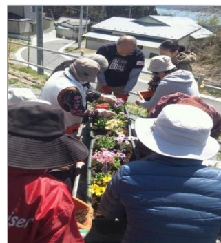
袖浜仮設での園芸プログラム

現在Solaでは、津波でほとんどの建物が流されてしまった南三陸町の歌津という地域に、子どもたちが自由に安心して遊ぶことのできる児童館を建てて、活動を広げようとしています。地元の方が、小・中学校の上にある高台の土地を無償で貸して下さることになり、建設会社の協力も得て、計画が進行しています。他の地域と同様、ここが子どもたちの安らぎの場所となり、一人ひとりが健やかに成長していけるよう準備を進めています。（歌津には、近く第二クリスチャンセンターも建てられる予定です。）