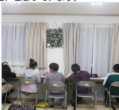
石巻の仮設集会所での学習支援

被災地の教会は、週日、仮設を訪問したり、炊き出しを行ったりとたくさんの働きを抱えています。そうした教会の働きを少しでもサポートできればと願っています。時々、私も一緒に仮設を訪問するお手伝いをさせていただいておりますが、そのような民生支援を色々な教会や支援団体が協力して行うことで、各地域の必要を知り、色々な世代に届く多面的なケアを行えるように努めています。地域や個人で状況は様々ですが、お一人ひとりが、一日一日を希望と喜びをもって歩めるように関わり支えていきたいと思っています。