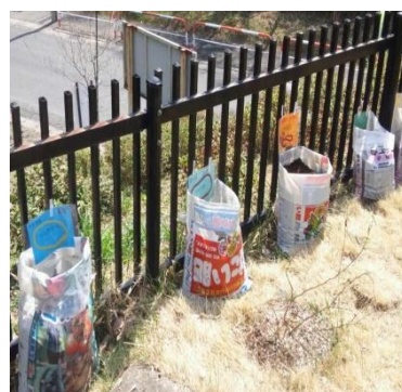
日本園芸療法（横浜）による園芸プログラム、「押し花、花壇、じゃがいも植え」を行いました。