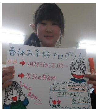
「春休み子どもプログラム」